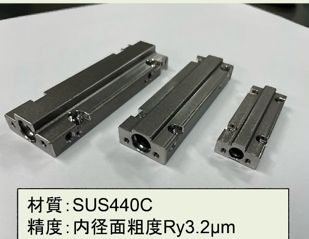
材質:SUS440C 精度:内径面粗度Ry3.2μm