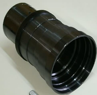
材質:A5056 φ120 六条ねじ 精度:真円度、振れ20μm