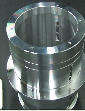
材質:A5056 φ120 精度:真円度、振れ20μm