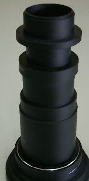
材質:A5056 φ100 精度:左右ネジ、ネジ位相50μm