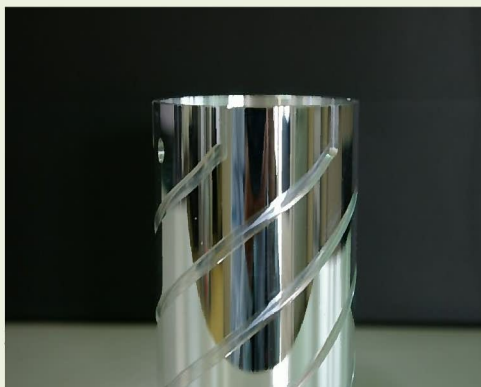
材質:A5056 φ80 精度:面粗さRa0.04μm カム溝加工